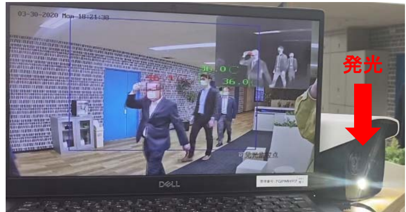
歩きながらの検温