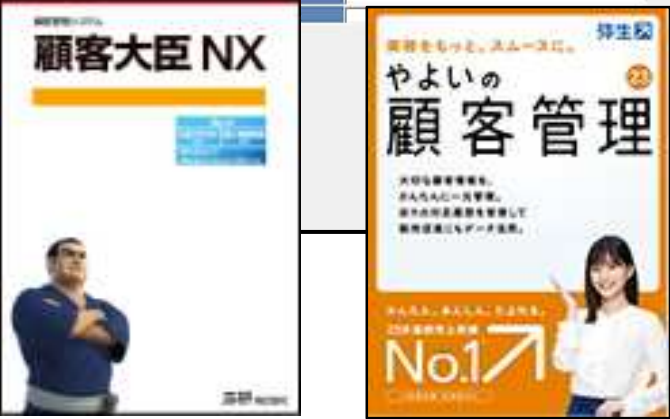
各社「顧客管理ソフト」と連動可能です